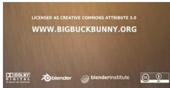
Big Buck Bunny - Blender Institute

También las plataformas de streaming suelen incorporar una opción para definir cuál es la licencia creative commons del vídeo